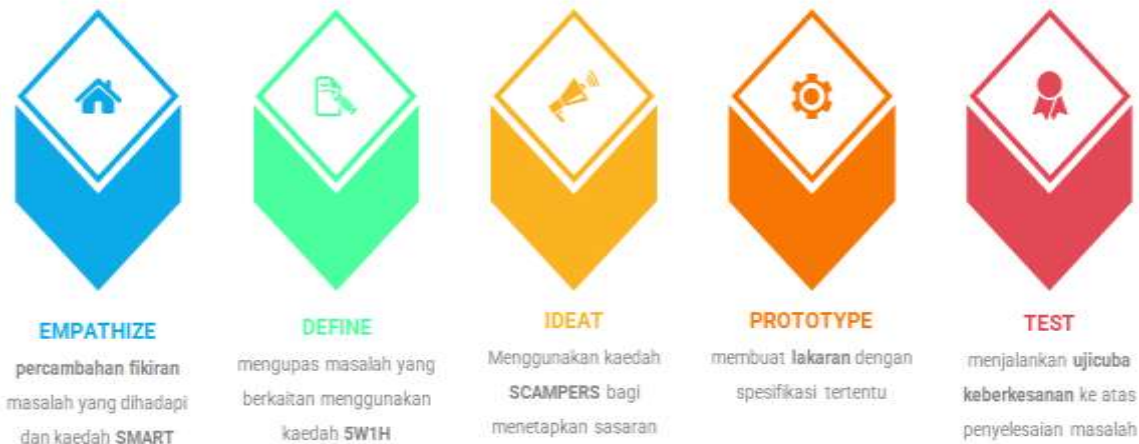
Rajah Design Thinking

Kaedah Design Thinking telah digunakan untuk melancarkan proses merekacipta idea yang dicetuskan secara teras dan berfokus. Berikut adalah fasa pelaksanaan yang terlibat.