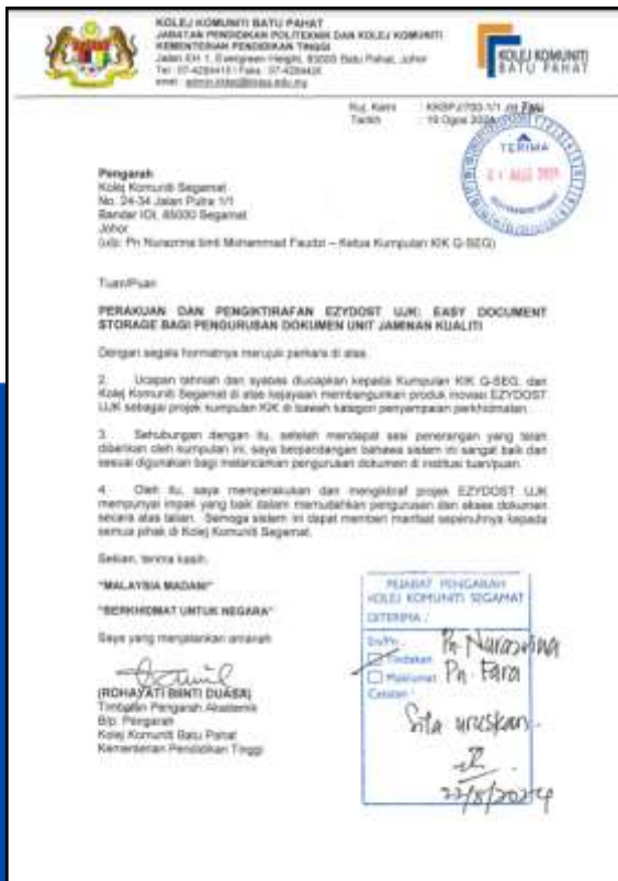
Kolej Komuniti Batu Pahat

Perakuan dua institusi pendidikan telah diperolehi bagi Ezydost UJK bagi memperkukan penggunaan projek ini iaitu daripada Kolej Komuniti Batu Pahat dan UiTM Cawangan Johor, Kampus Segamat.