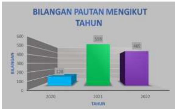
Bilangan Pautan Mengikut Tahun

Sebanyak 465 bilangan pautan yang dikongsikan pada tahun 2022 bagi memenuhi keperluan tugas sekaligus menyebabkan kekeliruan dan masalah kepada warga kerja untuk mencari pautan dokumen yang diperlukan pada masa tertentu. Penggunaan Ezydost UJK dapat mengumpulkan kesemua pautan berkaitan dokumen UJK di dalam satu sistem. Ini sekaligus meningkatkan pengurusan dokumen yang lebih sistematik dan teratur.