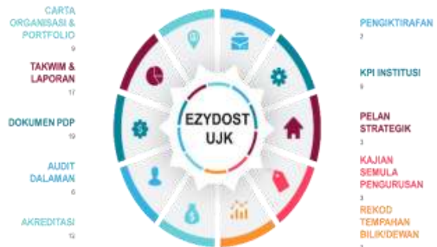
Pengumpulan Pautan UJK