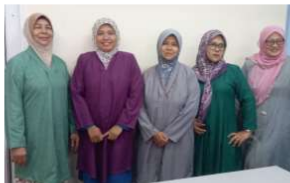
Peserta bergaya dengan hasil produk tugas modul yang telah diberi

Sepanjang program berlangsung, peserta telah dilatih dengan asas jahitan seperti cara mengukur badan, menggunakan mesin jahitan dan menggunakan kertas pola untuk menghasilkan model baju kebarong yang terkini.