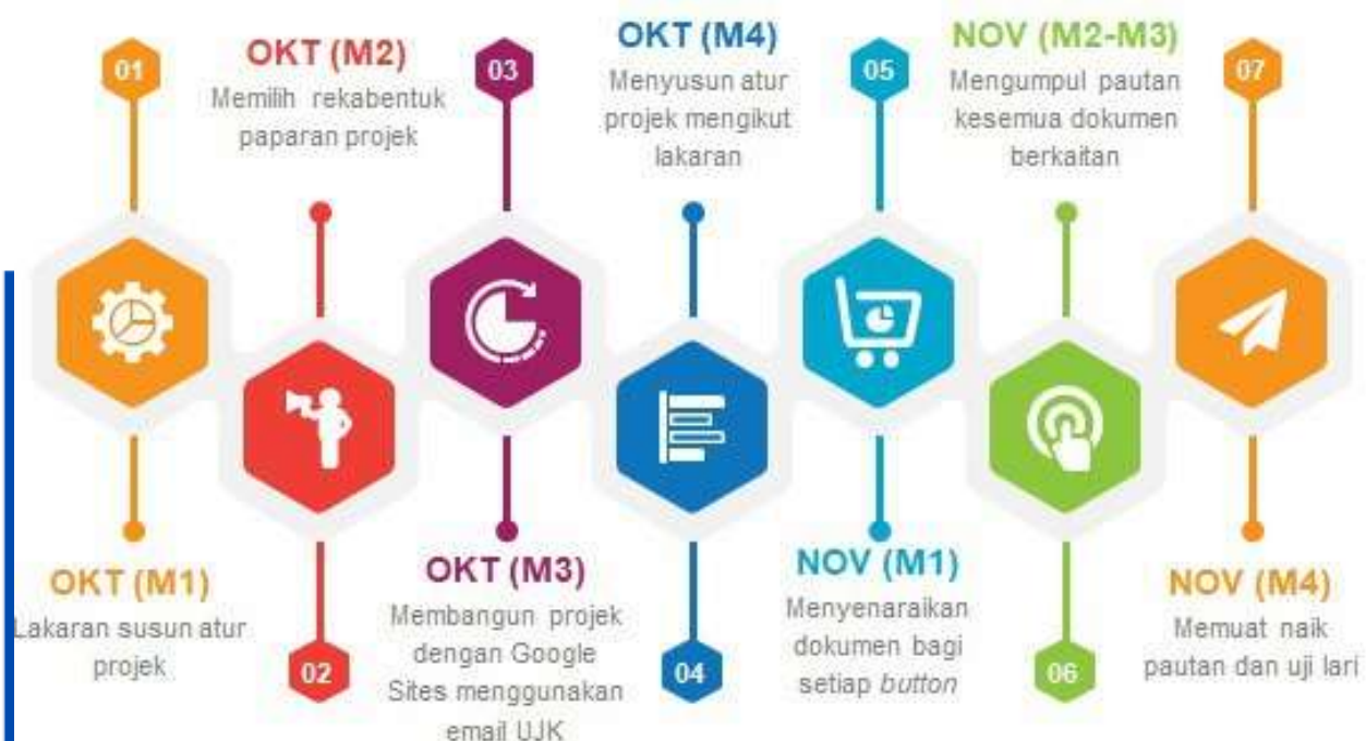
Rajah Masa Pembangunan Prototaip

Rajah masa pembangunan prototaip adalah penting untuk memberikan waktu, dan proses yang terlibat dalam pengembangan prototaip dan dimasukkan dalam rajah masa di bawah.